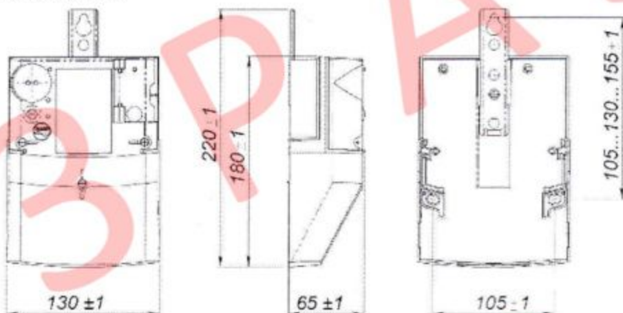
Рис. 2. Габарити та установочні розміри лічильника